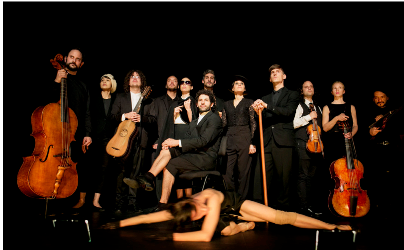
À l'Espagnole, fantasía escénica