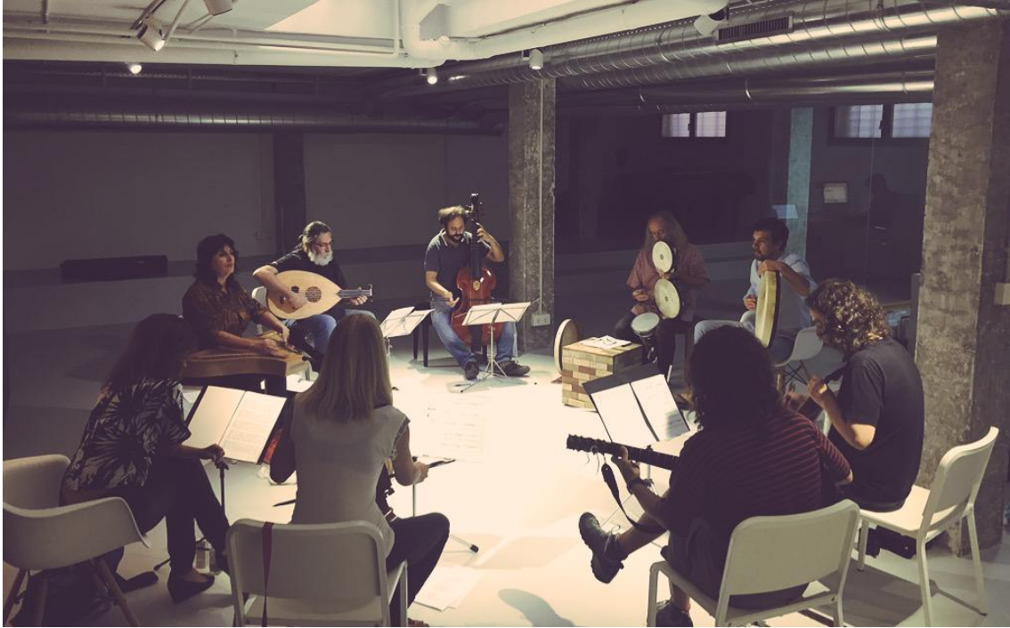
Ensayos de Romance en el nuevo local de Accademia del Piacere (Sevilla)

3) La incorporación de una cuarta persona a la infraestructura de personal de la empresa, para producción y venta.